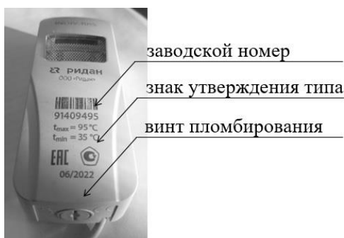
Рисунок 2 — Места нанесения заводского номера, знака утверждения типа, пломбирования